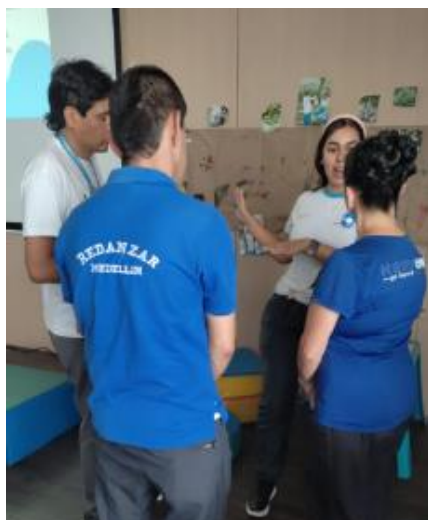
Cuidado del medio ambiente

El desarrollo del taller inicia con la ubicación de los asistentes en cada nicho que se encuentra identificado por color; como evidencia de la asistencia de los participantes por cada uno de los ambientes, se presenta el siguiente registro fotográfico: